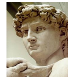
Michelangelo « David »

Dans le cadre de la Licence LEA, un stage obligatoire permet de rentrer en contact avec le monde du travail et l'Italie.