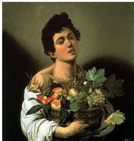
Caravaggio « Garçon avec un panier de fruits »

Tu souhaites travailler dans le tourisme, le commerce, dans le secteur économique, dans la haute technologie ou encore dans de grandes entreprises, etc. ?